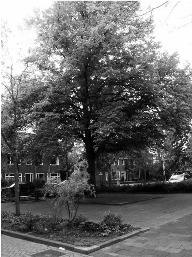
De bevrijdingsboom zoals hij er nu bijstaat op het pleintje hoek A.v.Cortenbachstraat / Lod. Houbenstraat.

Bij de viering van de eerste verjaardag van de bevrijding van Eindhoven werd de linde op het pleintje geplant op 18 september 1945. In de plantkuil onder de boom werd een zogenaamde "tijdscapsule" gelegd. Dit heeft altijd erg tot de verbeelding gesproken. Het is een stenen bolskruik die met kurk en zegellak is afgesloten en waarin een perkamente oorkonde is gedaan.