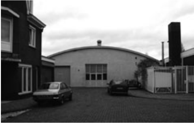
Voorterweg 128, op zoek naar een andere huisvesting.

Op 23 maart vergaderde de Stadsdeelcommissie Stratum. Er werd gemeld dat het kerkgenootschap dat zich in strijd met het bestemmingsplan heeft gevestigd aan de Voorterweg, op zoek is naar andere huisvesting.