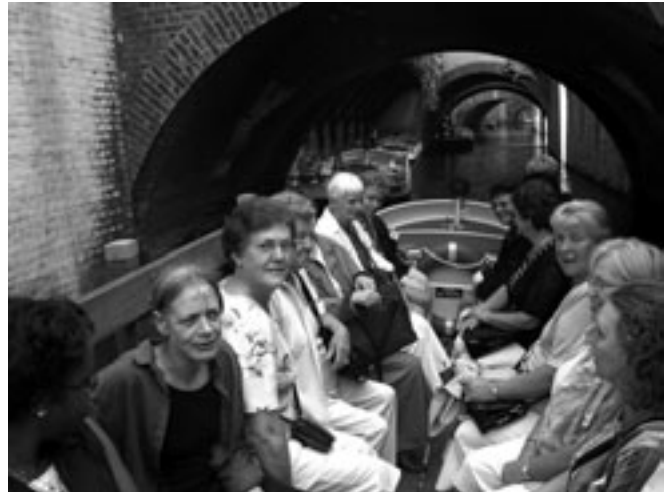
Rondvaart op de Binnen Dieze in Den Bosch.

Uitstapje Vrouwengroep Iriswijk. (zie artikel Blokhut 2 op pagina 4).