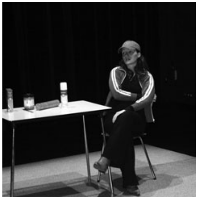
"Ik kom uit Amersfoort..." Een van de buurtbewoners uit de voorstelling Lang Leve Ik.