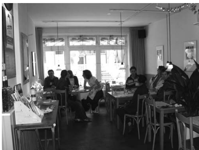
Tot slot werd in de Voorterpweg een bezoekje gebracht aan vegetarisch restaurant "de Iris". Zij zijn al 25 jaar in de wijk gevestigd. Behalve het restaurant verzorgen zij ook catering en een uitgeverij met kookboekjes.