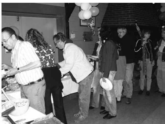
Na de wandeling werd van elkaars kookkunst genoten in de Blokhut.