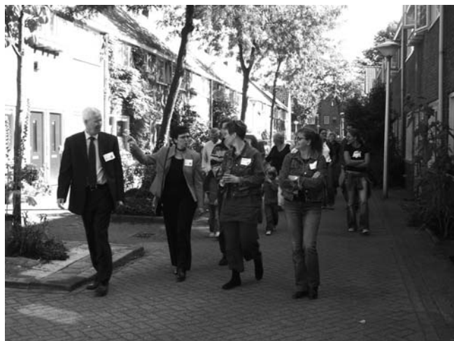
Vijf verschillende groepen wandelden door de wijk en lieten zich op dertien adressen verrassen door de bewoners.

17 september 2005 Kijk voor meer foto's op: www.kenjijirisal.nl