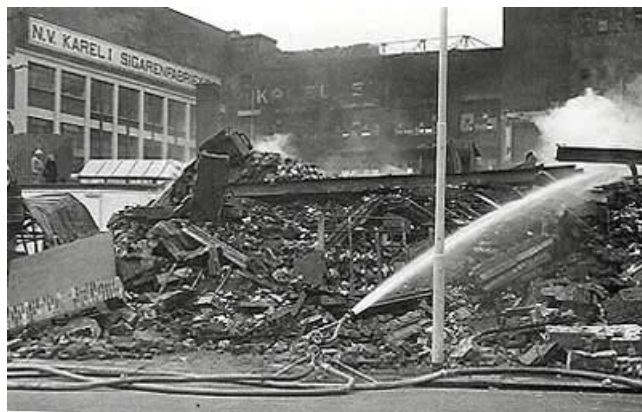
De verwoestende brand in 1971.

De villa is nu opgedeeld in appartementen. De splitsingsvergunning werd afgegeven op 11-8-'05. De villa bestaat nu uit acht tweekamer appartementen met een vloeroppervlak variërend van ca. 50 tot 75 vierkante meter.