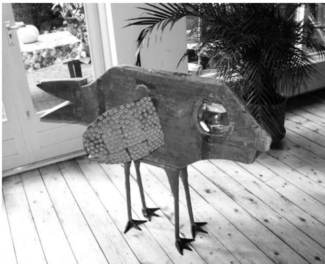
In de Godschalk Rosemondstraat waren beeldhouwwerk en schilderijen te bewonderen van Sabien Rutten.