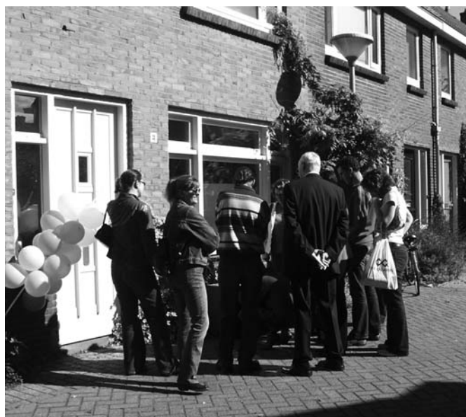
Verspreid op de wandeling stonden elf boxen waaruit verhalen klonken van bewoners over soms lang vervlogen tijden: de periode dat het nog een hoerenwijk was, het badhuis, de pipowagen, gebombardeerde huizen, enz.