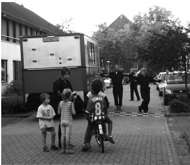
Een week voor het buurtfeest trok een geluidswagen door de wijk om m.n. kinderen erbij te betrekken.