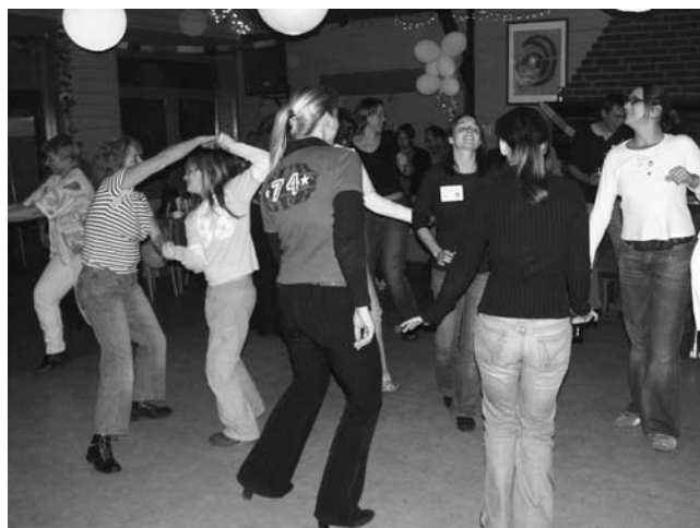
De avond werd afgesloten met een swingend feest.