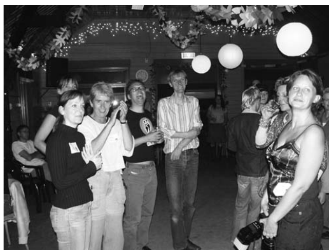
Enkele van de organisatoren. Nogmaals, Hartsikke bedankt!