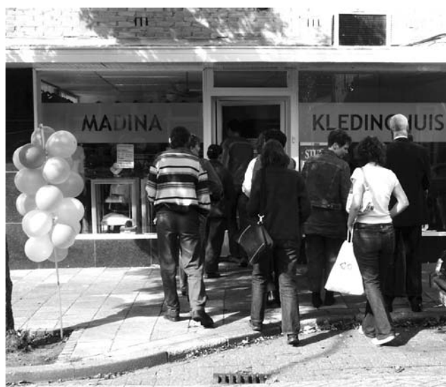
Ook de Hindoestaanse winkel was in de wandeling opgenomen.