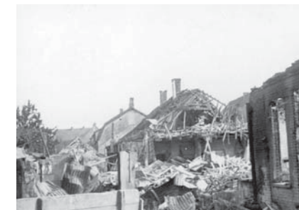
19 september 1944. De verwoestingen aan de Geldropseweg gezien vanaf de Voorterweg.