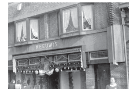
18 september 1944. Bevrijdingsétalage aan de Geldropseweg.