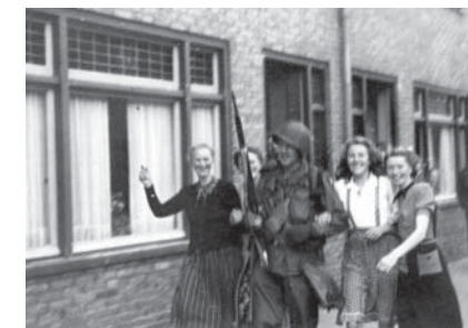
18 september 1944. Amerikaanse valschemjagers in onze straat. (Godschalk Rosemondstraat)