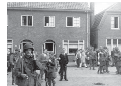
18 sept. '44. Eindelijk daar zijn ze (Voorteweg)

De dag na de bevrijding volgde nog een gruwelijk bombardement door de geallieerden waarbij ook delen van onze wijk zijn getroffen.