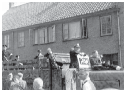
18 sept. '44. Ophalen der NSB-ers.