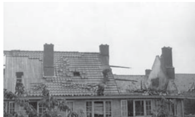
19 sept. '44. Joh.v.Eindhovenstraat vanuit ons dakraam gezien. (vanuit de God.Rosemondstr. 11)

Oplage: 950 redactieadres: Joh.v.Eindhovenstraat 7 56111 TK Eindhoven. iriskrant@tiscali.nl www.iriskrant.dse.nl Verschijningsdata volgende nummers: 25 oktober, 20 december 2006. Inleveren kopij voor nr. 23: vóór 10 okt. 2006