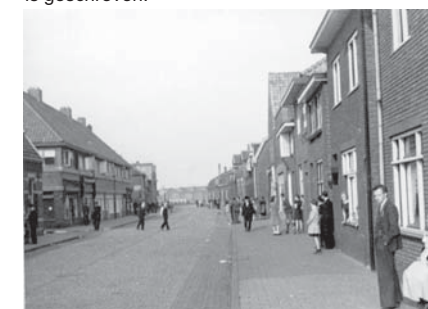
18 sept. '44. Wachtend op onze Amerikaanse vrienden. Voorteweg.

De onderschriften bij de foto's zijn letterlijk overgenomen van de tekst die achter op de foto's is geschreven.