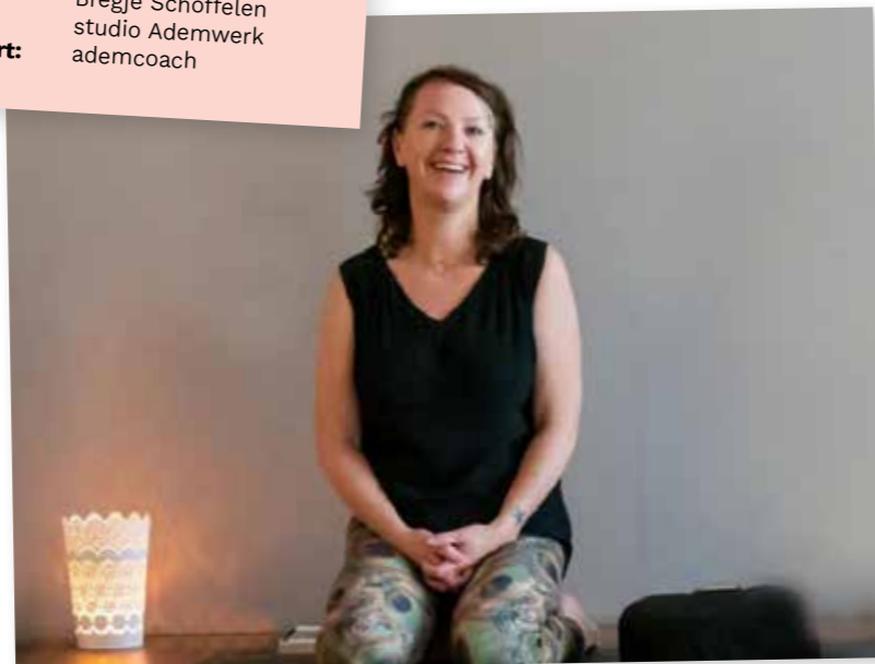
Ben jij zzp'er en wil je ook een keer in deze rubriek verschijnen? Meld je aan via tinyurl.com/IrisOproep .