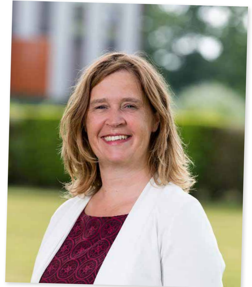
Ben jij zzp'er en wil je ook een keer in deze rubriek verschijnen? Meld je aan via tinyurl.com/IrisOproep .