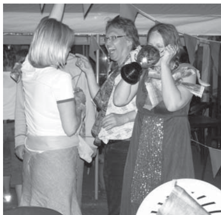
De zoete smaak van de overwinning. Lees er alles over op pagina 8.

Hebt u vragen of klachten over de openbare ruimte dan kunt u het beste contact op nemen met het Klantcontactcentrum van de gemeente Eindhoven via 040 - 238 6000.