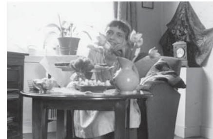
Els thuis, rond 1960.