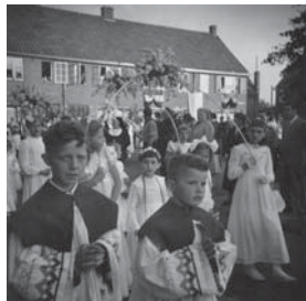
Processie. Het rijke Roomse leven in de Iriswijk.

Haar ouders waren in 1941 in het huis komen wonen en hebben tijdens de oorlog het bombardement van 6 december 1942 op Eindhoven van heel dichtbij meegemaakt, want tijdens dit bombardement werden de twee tegenoverliggende huizen aan de van Cortenbachstraat, namelijk nummer 67 en 69 weg gebombardeerd.