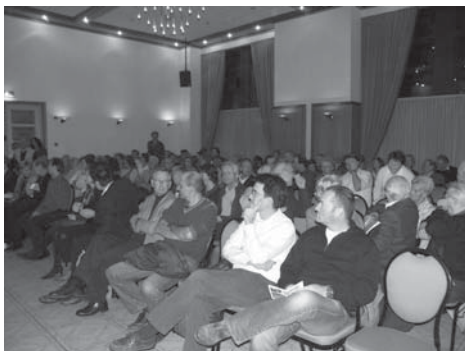
De avond trok 125 belangstellenden