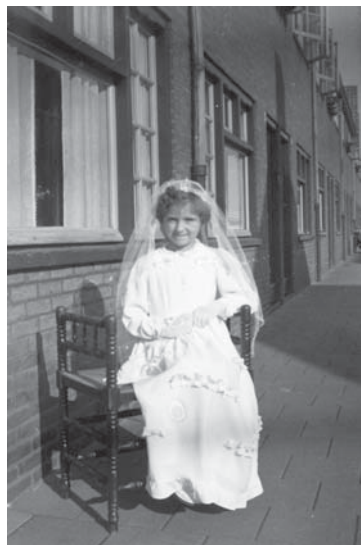
18 oktober 1953. Eerste Heilige Communie.