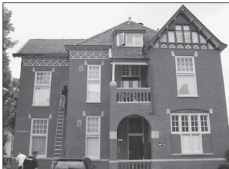
foto: de gestolen koperen pijpdelen worden tijdelijk vervangen door plastic pijpen

In het Eindhovens Dagblad van 6 juni stonden twee artikeltjes over koperdieven die in de regio actief zijn. Bij zeven kerken van het bisdom Den Bosch waren koperen regenpijpen gestolen en er was een koperdief betrapt met een tas vol koper dat afkomstig was uit de sloopwoningen in de Bloemenbuurt-Zuid. In diezelfde week werd echter ook hier in de Iriswijk koper gestolen, nota bene op klaarlichte dag! Op maandagmiddag werd al een aantal regenpijpen van de Rietvink, de monumentale villa op de hoek van de Tongelresestraat en de Korte Havenstraat, ontvreemd. De donderdag daarna werd een dief op heterdaad betrapt tijdens het losmaken van de pijpen. De dief wist echter met de buit te ontsnappen, simpelweg per fiets. Mocht u iemand hebben zien fietsen in de buurt met koperen regenpijpen bij zich, meld dit dan vooral bij de politie. ■