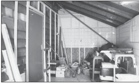
De keuken van de Blokhut tijdens de verbouwing.