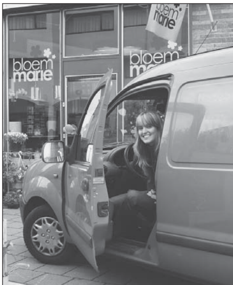
De auto waar kinderen bloemen op mogen schilderen.