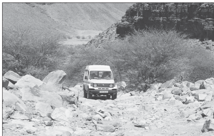
De Landcruiser die nu te koop staat in de Iriswijk

Gabriël Metsulaan 112 Eindhoven (hoek Geldropseweg) tel. 040 - 213 65 27 www.defonteineindhoven.nl