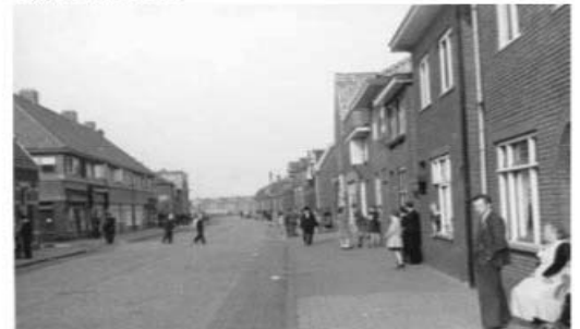
18 sept. '44. Wachtend op onze Amerikaanse vrienden. Voorterveen.

De onderschriften bij de foto's zijn letterlijk overgenomen van de tekst die achter op de foto's is geschreven.