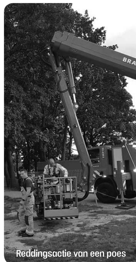
Reddingsactie van een poes