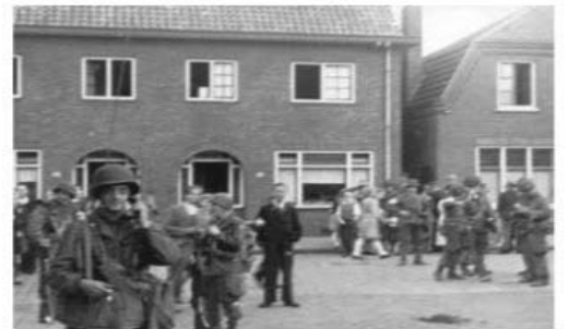
18 sept. '44. Eindelijk daar zijn ze (Voorterveen)

De dag na de bevrijding volgde nog een gruwelijk bombardement door de geallieerden waarbij ook delen van onze wijk zijn getroffen.