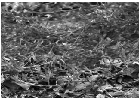
Varkensgras (Polygonum aviculare)

De plant is op vele manieren gebruikt. Hij werd benut in middeltjes tegen puisten en slangenbeten en is ontstekingsremmend. De plant wordt tussen de 10 en de 100 cm hoog.