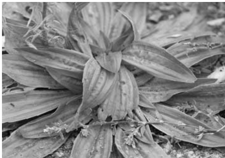
Smalle weegbree (Plantago lanceolata)

wurging om het leven kwam, nog de zaden van het Varkensgras gegeten, verwerkt in een gerecht (de maaltijd bevatte verder Gerst, Lijnzaad, de zaden van de Huttentut, Melganzevoet en Akkerviooltje). Het kruid wordt genoemd in Shakespeare's 'Midsummernights Dream', als "that hindering Knotgrass", omdat gedacht werd dat het kruid de groei van kleine kinderen en dieren zou belemmeren. Het is een plantje dat plat over de straat kruipt met fijne lange stengels.