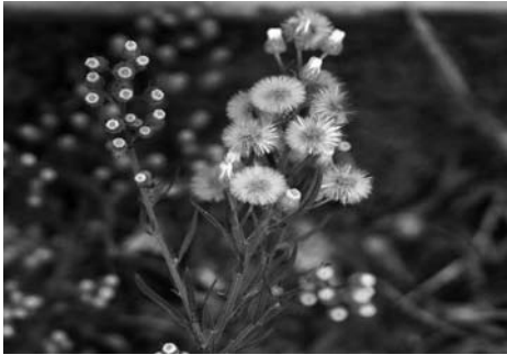
Canadese fijnstraal (Erigeron canadense)