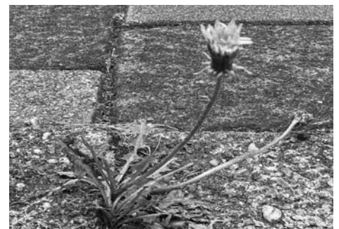
De paardenbloem (Taraxacum officinale)

Dit plantje lijkt heel veel op de paardenbloem, maar dan zijn de stengels veel dunner en langer. Alle delen van biggenkruid (net als bij de paardenbloem) zijn eetbaar. De bladeren zijn op het best in het voorjaar, dan zijn ze zacht van smaak en ideaal in een salade. Maar je kan ze ook koken, stomen, roosteren of roerbakken. De bloemen zijn mooi als versiering. Het plantje wordt 20-60 cm hoog.