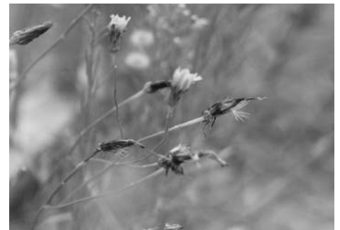
Biggenkruid (Hypochaeris radicata)

bijvoorbeeld op een boterham. Oudere bladeren zijn wat bitter en lastig om te bereiden. De bladeren staan allemaal in een bloemvorm en de plant wordt 10 tot 80 cm hoog