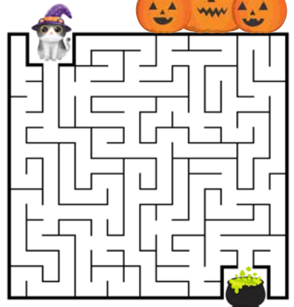
Help jij dit schattige heksje haar heksenketel terug te vinden?